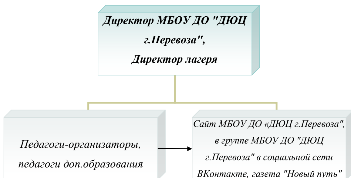
Схема распространения информации:

Регулярно о деятельности лагеря и его достижениях, детях сообщается в лагерной газете, на сайте МБОУ ДО «ДЮЦ г.Перевоза», в группе МБОУ ДО «ДЮЦ г.Перевоза» в социальной сети ВКонтакте.